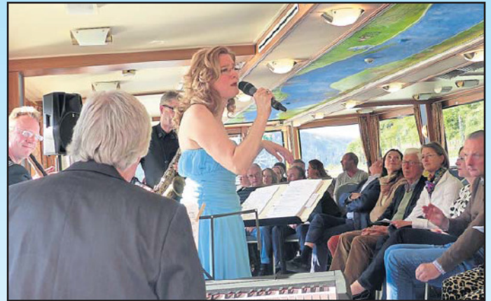
Konzert auf der MS RheinStar: Zu den jazzigen Rhythmen von Deborah Lynn Cole und ihrer Band glitt das Schiff durch die Rheinlandschaft.

Classico“. Wer gewinnen möchte, einfach eine Postkarte mit der richtigen Antwort auf die Frage „Wo findet das Benefizkonzert am 27. Januar statt?“ an das Rheingau Echo, Industriestraße 22 in 65366 Geisenheim schicken. Absender und eine Telefonnummer, unter der man tagsüber zu erreichen ist, nicht vergessen. Auch eine Teilnahme per Mail an echoredaktion@rheingau-echo.de ist möglich. Einsendeschluss ist der kommende Dienstag, 16. Januar. Die Gewinner werden benachrichtigt und können sich ihre Eintrittskarten dann direkt beim Rheingau Echo abholen.